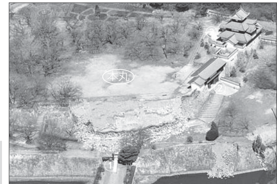
①清水門 ②前御門 ③三重櫓

修復は、 清水門 ・ 前御門 ・ 本丸 ・ 三重櫓 までを開放できるようにするため、その経路上に存在する清水門・本丸南面・前御門・三重櫓の修復を最優先に行います。そのほかの崩落箇所については、継続して修復を進め徐々に開放範囲を広げていく予定です。 また、園路や照明などの整備を行うとともに、景観の阻害や、石垣に悪影響を与えている樹木なども整理していきます。