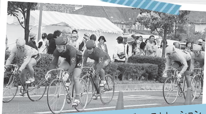
プロの競輪選手による競輪のデモンストレーション Giro d' Shirakawa 2013 10月12日/白河羽鳥レイクライン (JR白河駅前)