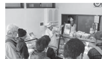
↑白河まちなか逸品めぐりツアーでは、加盟店を巡り、個店からお勧め品が紹介されました。