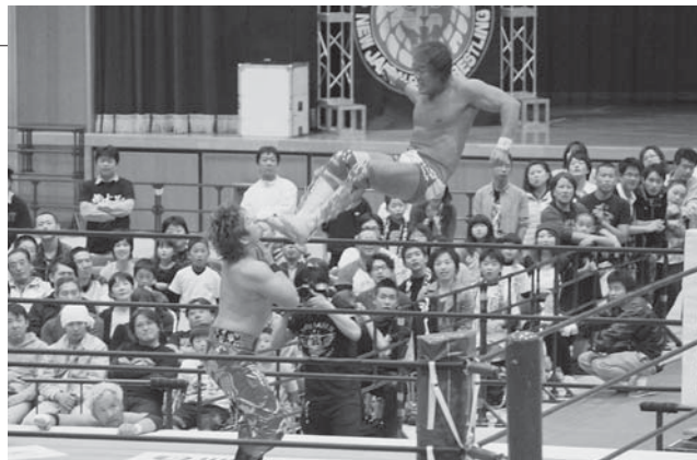
▲迫力のある試合展開に見入る来場者

10月16日、中央体育館（北中川原）で「新日本プロレス白河大会」が開催されました。この大会は公益社団法人白河青年会議所の創立55周年記念プロジェクト「新日本プロレスからのメッセージ」の一環で行われたものです。高校生以下が無料で入場できたこともあり、会場には多くの子どもたちの姿が見られました。リング上での手に汗握る試合展開や、各選手が見せるアクションに、1,000人を超える来場者からは、終始大きな拍手や大歓声がわき起こっていました。