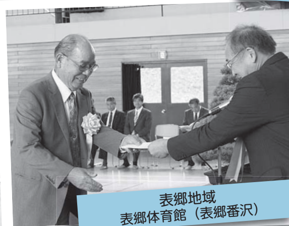
表郷地域 表郷体育館 (表郷番沢)