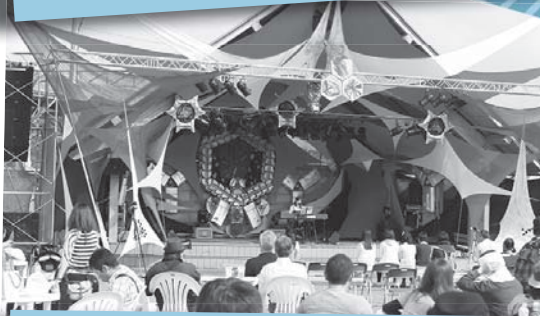
白河発、ミライをつくる全員参加型文化祭!! ライブラリー白河2013 10月5日・6日/JR白河駅前イベント広場