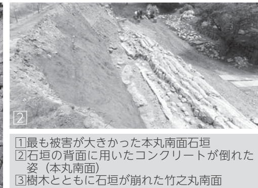
①最も被害が大きかった本丸南面石垣 ②石垣の背面に用いたコンクリートが倒れた姿（本丸南面） ③樹木とともに石垣が崩れた竹之丸南面