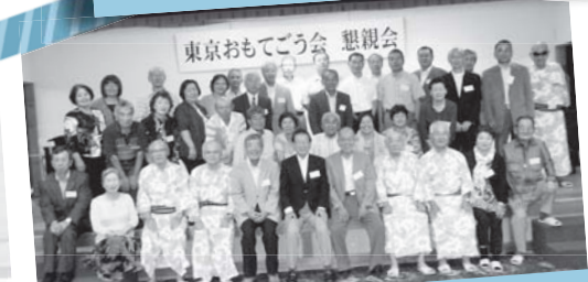
親睦旅行でふるさとを満喫! 東京おもてごう会親睦旅行懇親会 9月22日/ホテル&コテージ白河関の里 (表郷金山)