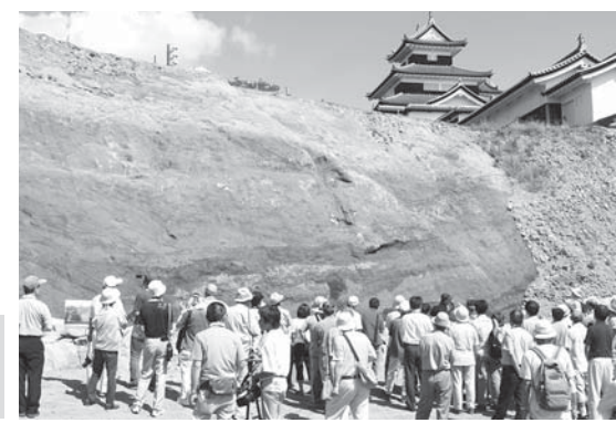
約250人が参加した昨年の見学会

石垣が構築される姿は、なかなか目にする事ができない貴重な機会です。その姿を多くの方が目にし、小峰城の歴史をさらに知ってもらえるよう、これまでと同じく見学会を開催し、修復の状況を公開していきます。