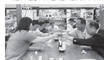
↑一店逸品ちよい飲みツアーでは、お酒が飲める加盟店3店舗を巡りました。