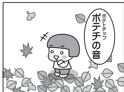
枯れ葉ゼーンぶポテチだったらな～