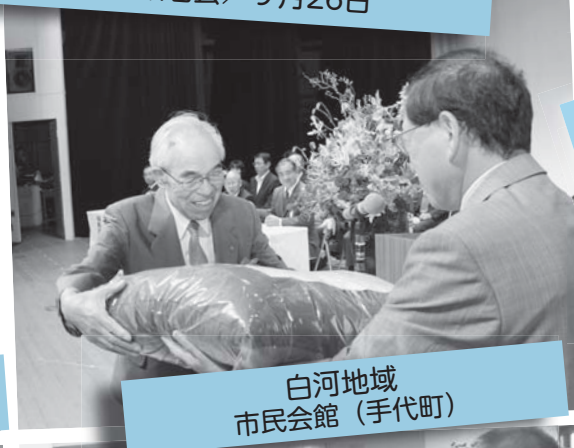
白河地域 市民会館 (手代町)