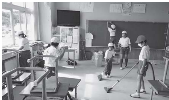
▲縦割り班による清掃活動の様子

人のために自分を役立てる心を育てるために、 清掃活動に力を入れています。清掃の上手な班 を「金のほうきグループ賞」として表彰するこ とで、連帯感が育ってきています。