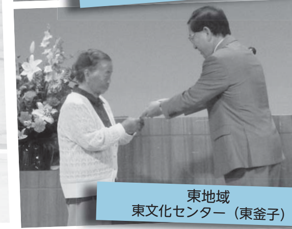
東地域 東文化センター (東釜子)