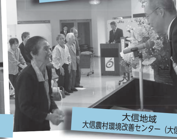
大信地域 大信農村環境改善センター (大信町屋)