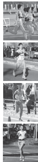
●本庁舎生涯学習スポーツ課 内2386