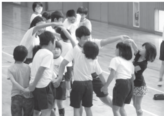
▲縦割り班活動での「人間知恵の輪」