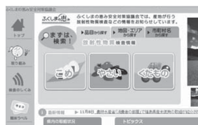
▲ふくしま恵み安全協議会のホームページ