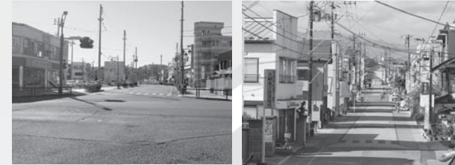
▲①白河駅白坂線 ▲②一番町大工町線