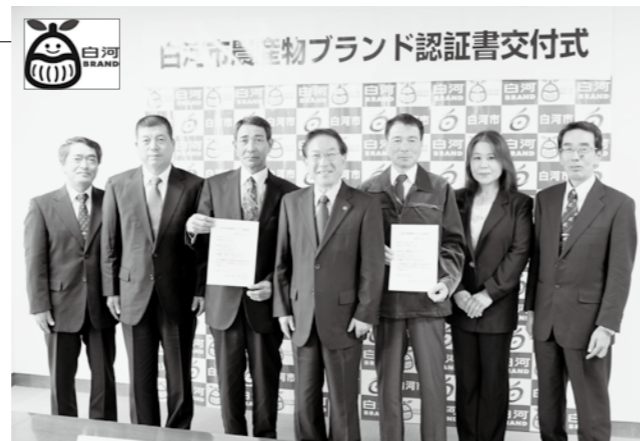
▲農産物ブランド認定書交付式の様子（左上はブランドマーク）

10月27日、市役所で「白河市農産物ブランド認証書交付式」が行われ、新たに2つの産品が認証されました。昨年からはじめたこの農産物ブランド認証制度では、これまで9品目が認証を受け、今回、白河ベジファーマーズの「きつね米」と北條農園の「りんご飴」が加わり、白河ブランドの認証は11品目となりました。認証産品は「白河市農産物ブランドマーク」を付けて販売されます。