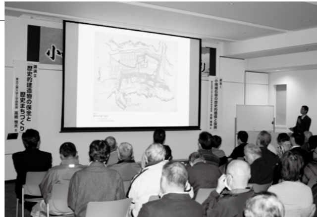
▲約200人が参加した講演会の様子

12月4日、市立図書館（道場小路）で「歴史まちづくり講演会」が開催されました。これは、東日本大震災で甚大な被害を受けた小峰城跡や歴史的建造物の復興と、今後の歴史まちづくりについて考えようと開催されたもので、東北工業大学の高橋恒夫教授と東北芸術工科大学の北野博司准教授が講演を行いました。来場者は、貴重な歴史資源である小峰城跡や歴史的建造物の価値を再認識し、歴史まちづくりについての理解を深めました。