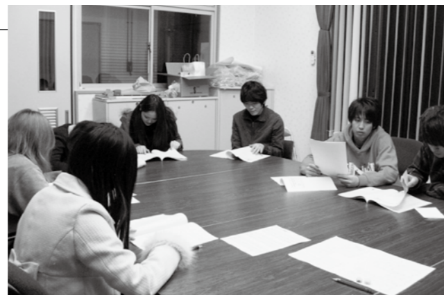
▲成人式について話し合う実行委員（大信地域）

1月8日に行われる成人式に向けて、各地域の実行委員会が活動しています。委員は新成人の代表たちで構成され、夏から会議を重ね、アイデアを出し合い準備を進めてきました。その結果、地域別の催しとして、地元企業協賛品の抽選会（白河）、新成人の手書きメッセージ（表郷・大信・東）、思い出のスライドショー（白河・東）などが行われる予定です。思い出に残る成人式になるよう、各地域の委員とも一丸となって奮闘しています。