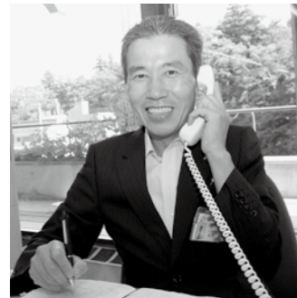
保健福祉部長 矢内辰雄