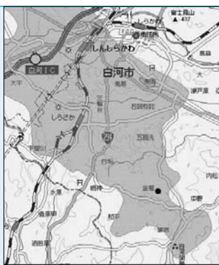
●本庁舎企画政策課 内2398