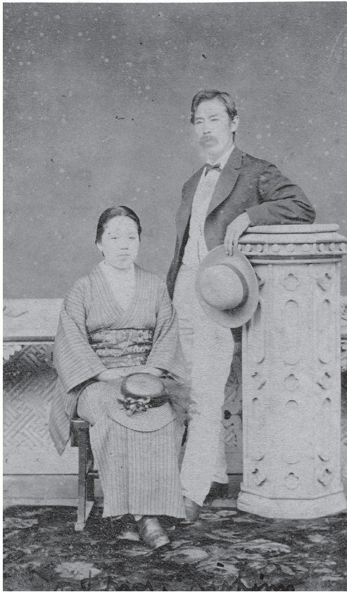
八重と襄 「結婚したころの二人」 Jo, Yae Nijijima's photograph

新島八重や襄に関する数多くの遺品を紹介しながら、会津出身の女性として覚悟と矜持を持って生き抜いた八重の生涯を、いくつかのテーマを設けて展示します。