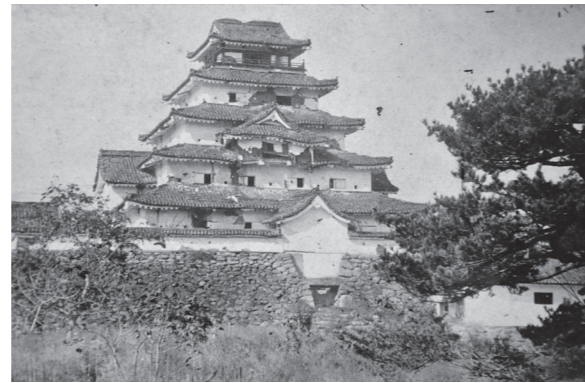
八重遺品「籠城戦後の若松城写真」 Yae Nijijima's article left by the departed