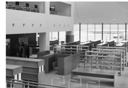
▶新図書館内の様子