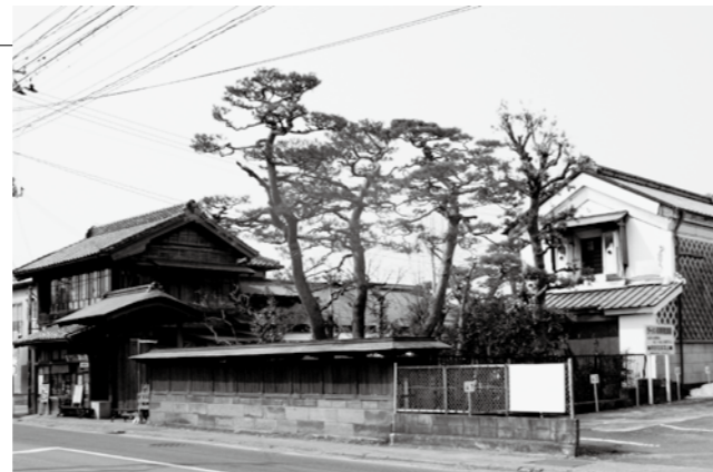
▲歴史的風致形成建造物「藤屋建造物群」（二番町）

第一次指定として「藤屋建造物群」など13件を指定しました。引き続き、歴史的建造物を調査の上順次指定を行い、保全を図っていきます。