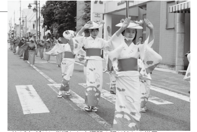
▲約10年ぶりに復活した白河関の踊り流しの様子

夜には城山公園（郭内）で「市民納涼花火大会」が行われ、東日本大震災で犠牲になった方への追悼花火も含め、約4,500発の花火が夜空を彩り、詰め掛けた観客から歓声が上がりました。