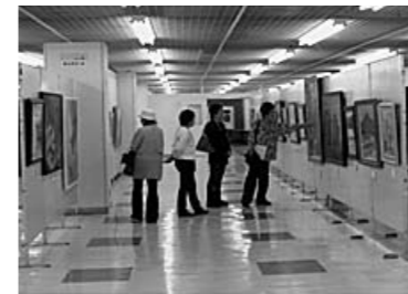
▲市民総合美術展覧会開催事業

日ごろの活動の成果を発表する事業を支援します。ただし、5年以上の周年記念事業である場合に限りです。