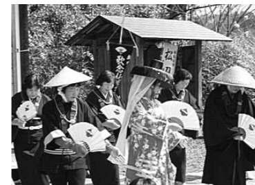
▲無形文化財保存育成事業