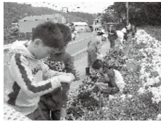
▲植物にもやさしいまなざし