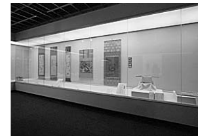
▲歴史民俗資料館展示室の改修

市民の皆さんや子どもたちが、芸術文化に触れる機会を提供する場としての文化施設の改修や整備を行います。