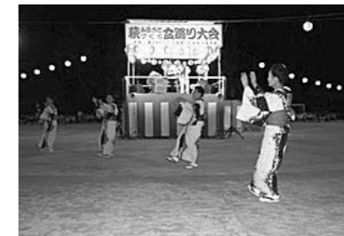
▲萩ふるさと盆踊り大会参加事業

県内外での発表会等への資格を取得、または招へいされた場合の旅費などを支援します。