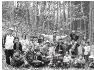
▲広い山林での「すずめの学校」