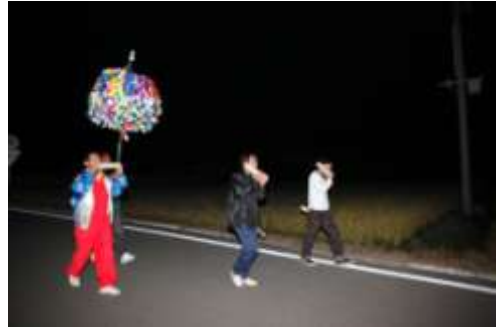
中ノ沢権現梵天祭

中ノ沢権現梵天祭（市指定）は、表郷梁森地区に伝わるもので、大山祇神を祀る中ノ沢権現で、五穀豊穡を祈願し行われるようになったといわれている。奉幣は、隔年旧暦8月8日に行われている。