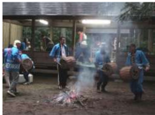
河東田牛頭天王祭

河東田牛頭天王祭（市指定）は、表郷河東田地区に伝わる祭礼である。牛頭天王は、インドの祇園精舎の守護神で、除疫神として祀られた。由来より考えると旧暦6月の祭事であり一種の夏越萩であり、胡瓜天王の謂から農神としても崇められた祭神である。祭礼は現在も継承され、毎年6月14日・15日に実施されている。現在は、地区にある4基の太鼓を打ち鳴らし祭礼を盛り上げている。胡瓜を祭壇に供え五穀豊穡を祈る風習のあるところから、別に「胡瓜天王様」ともいわれている。