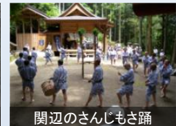
関辺のさんじもさ踊