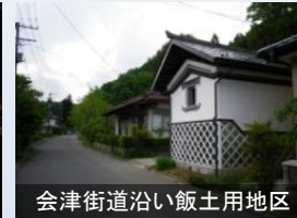
会津街道沿い飯土用地区