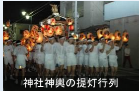
神社神輿の提灯行列

350年の伝統を持つ鹿嶋神社祭礼の「白河提灯まつり」の神輿渡御と山車の練り歩きは、現在も町の人々に継承されている。