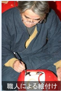
職人による絵付け