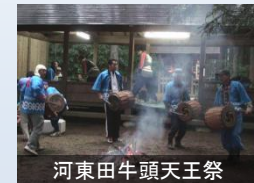
河東田牛頭天王祭

福島県の南部には「天道念仏」という太鼓を打ち鳴らす念仏踊りが継承されている。現在でも市域の各地に広く伝承されており、牛頭天王祭なども融合し、それぞれの地域の趣を醸し出している。