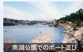
南湖公園でのボート遊び

200年前に白河藩主松平定信によって開設された南湖公園における花見・舟遊び等の行楽は、現在も市民等に引き継がれている。