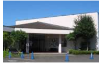
白河市歴史民俗資料館

文化財に関する案内・説明板等の設置については、「サイン統一計画」の策定に基づき色調やデザインの統一を図り、未設置箇所を中心に設置していく。