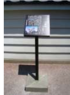
指定文化財説明板