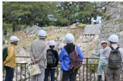
小峰城跡石垣修復箇所一般公開の様子

さらには、東日本大震災により崩落した小峰城跡の石垣修復に対する理解や関心を深めるため、工事の進捗状況や小峰城跡の様子などを定期的に一般公開している。