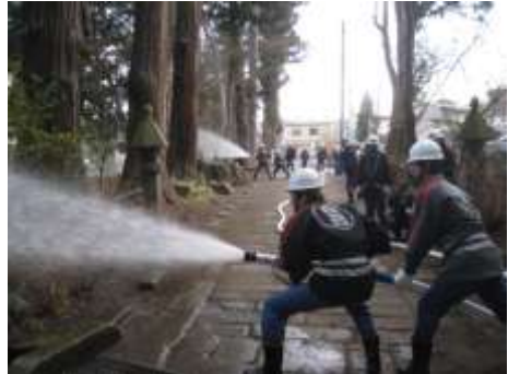
火災防御訓練の様子

文化財を災害から守り、後世に正しく引き継ぐためには、管理体制の整備が不可欠である。白河市では、「白河市地域防災計画」を定め、文化財管理者への指導として、定期的な防火診断の受診や自主的な点検の実施による火災発生の防止と火災原因の早期発見に努めることや、消火・警報設備の整備促進を図ることなどのほか、文化財保存施設の整備として、災害防止のため、耐火耐震の設備や施設の設置を推進している。現在のところ、消防法で義務付けられている重要文化財（建造物）はないが、火災発生の際、迅速に対応できるよう、義務付けられていない文化財についても自動火災報知器や消火器の設置を推進していく。特に初期消火の基本である消火器の設置については、建造物のみならず、重要文化財を所蔵している場所についても、補助制度等を活用しながら設置していくよう努める。