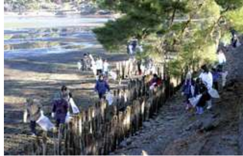
南湖清掃ボランティア

また、県指定重要無形民俗文化財「奥州白河歌念仏踊」に関して、白河根田安珍歌念仏踊保存会や大和田長寿会の各団体が、地元の小中学生に民俗芸能を継承するための活動を行っている。今後も、これらの団体等と連携して文化財の保存・活用に努めていく。