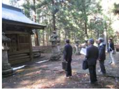
文化財保護審議会現地視察

白河市では、文化財の保存・活用に関する業務は、建設部都市政策室文化財課（文化財保護係・史跡整備係）の11人で担当している。事務所を歴史民俗資料館内に置き、収蔵資料内の文化財の保存・活用について、より密接に関わることができる体制となっている。また、白河集古苑の職員を文化財課職員が一部兼務しているため、集古苑所蔵の文化財の保存・管理について、速やかに対応できる体制となっている。