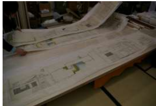
白河城御櫓絵図(県指定)の修復