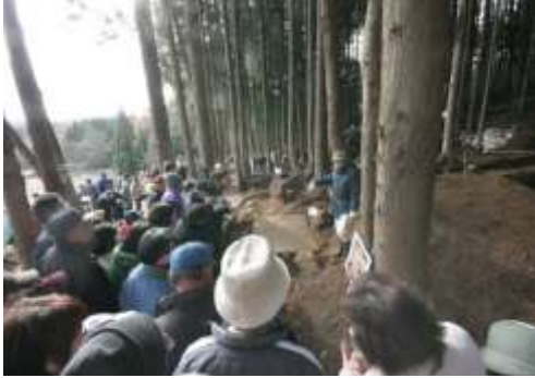
埋蔵文化財現地説明会の様子

市内の文化財を広く市民へ公開し、文化財保護精神の普及・啓発を図るため、白河市ではホームページで国・県・市指定の文化財を写真及び説明付きで分かりやすく紹