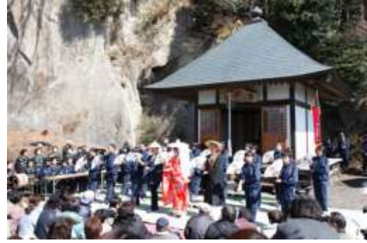
地域の民俗芸能を披露する中学生

介しているほか、すべての指定文化財への誘導・説明板の設置を進めている。また、埋蔵文化財発掘調査の現地説明会を開催しているほか、出前講座事業や各団体の学習会等に積極的に講師派遣を行うなど、文化財に対する知識・理解の高揚に努めている。さらに、文化財保護強調週間及び文化財防火デーに併せた文化財の公開等も実施している。