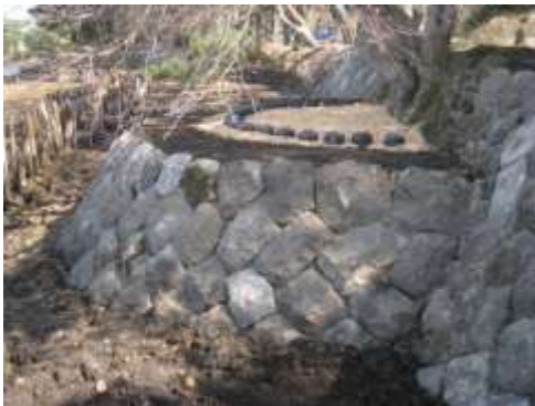
史跡及び名勝南湖公園の護岸整備

今後も、文化財の状況を常に把握した上で、法令に基づき適切な保存を図るとともに、計画的な修理・整備を行う。また、専門的な指導・助言を得ながら、文化財が持つ歴史的価値の保持に努めていく。