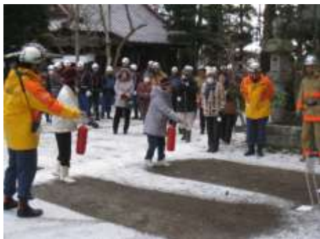
消火器による火災防御訓練

防災訓練については、文化財防火デーに併せ、火災防御訓練を実施している。実施にあたっては、各地域の建造物を中心とした指定文化財を対象に、市関係各課のほか、所有者・消防署・地元消防団・地元町内会等と連携を図りながら実施しており、地元住民が地域に残る貴重な文化財を自分たちで守っていく意識付けを行うとともに、消火器を使った火災防御訓練を実際に体験することで、火災防御のレベルアップを図っている。