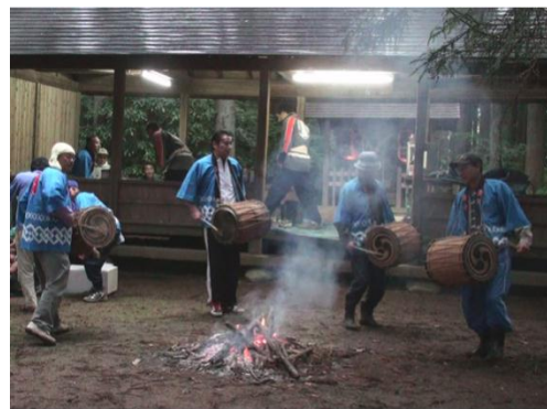
河東田牛頭天王祭

河東田牛頭天王祭（市指定）は、表郷河東田地区に伝わる祭礼である。牛頭天王は、インドの祇園精舎の守護神で、除疫神として祀られた。由来より考えると旧暦6月の祭事であり一種の夏越萩であり、胡瓜天王の謂から農神としても崇められた祭神である。祭礼は現在も継承され、毎年6月14日・15日に実施されている。現在は、地区にある4基の太鼓を打ち鳴らし祭礼を盛り上げている。胡瓜を祭壇に供え五穀豊穡を祈る風習のあるところから、別に「胡瓜天王様」ともいわれている。