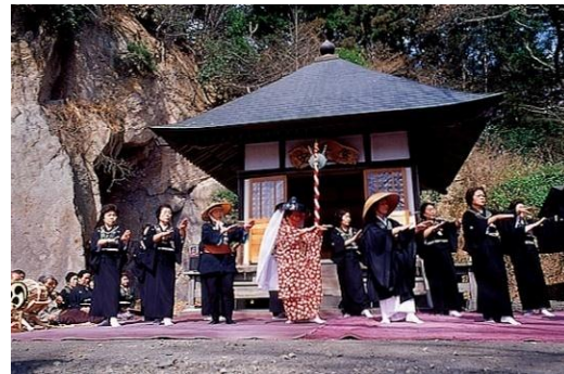
奥州白河歌念仏踊

奥州白河歌念仏踊（県指定）は、白河付近の村々に伝承されている。根田組、久田野組、釜の子組、柏野組、羽太組等それぞれの集落にある念仏踊りは、村内安全と五穀豊穡を祈ることに始まったといわれるが、長い間に舞踊化し、交情和親の娯楽ともなっており、各村に定着した。なお、根田地区においては「道成寺物語」の安珍僧が、市内萱根の生まれと伝えられ、これにちなんだ歌詞や踊りがあるので「安珍念仏踊」として有名である。旧暦2月27日（現在は3月27日）の安珍忌には歌と踊りで供養する。