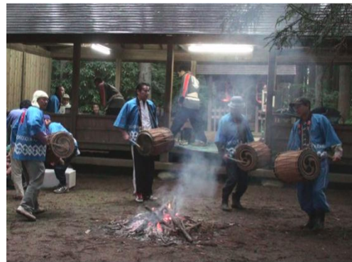
河東田牛頭天王祭

河東田牛頭天王祭（市指定）は、表郷河東田地区に伝わる祭礼である。牛頭天王は、インドの祇園精舎の守護神で、除疫神として祀られた。由来より考えると旧暦6月の祭事であり一種の夏越萩であり、胡瓜天王の謂から農神としても崇められた祭神である。祭礼は現在も継承され、毎年6月14日・15日に実施されている。現在は、地区にある4基の太鼓を打ち鳴らし祭礼を盛り上げている。胡瓜を祭壇に供え五穀豊穡を祈る風習のあるところから、別に「胡瓜天王様」ともいわれている。