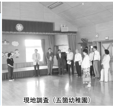
現地調査（五箇幼稚園）

答 県の補助割合が総事業費の約1/3となることから、関係機関と協議し、市町村も事業主体もおおよそ1/3となるよう考慮したものです。