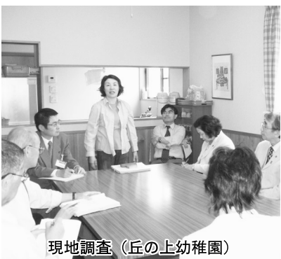
現地調査（丘の上幼稚園）