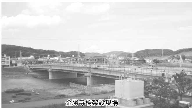
金勝寺橋架設現場