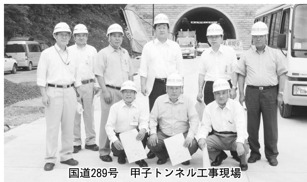
国道289号 甲子トンネル工事現場