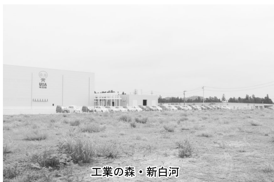
工業の森・新白河