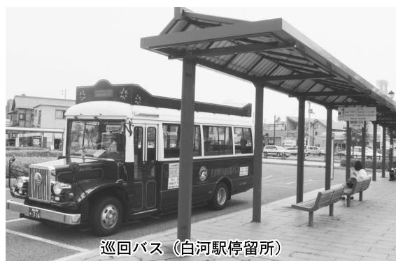
巡回バス（白河駅停留所）

問 循環バスの利用実績は。 答 昨年の10月から今年3月までの南湖公園先回り新白河駅先回り1便当たり平均4・23名利用しています。