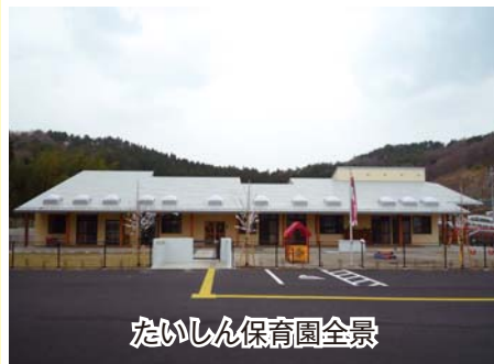
たいしん保育園全景

たいしん保育園の開園式が4月1日に行われました。 新たな園舎は、木造平屋建て・延べ床面積541平方メートルで、0歳児から2歳児までを預かり、定員は50人となっています。 開園式、玄関前でのテープカットの後、今年度新入児の入園式が行われ、0歳児2人、1歳児4人、2歳児1人の計7人が加わり、現在は29人の乳幼児が入園しています。