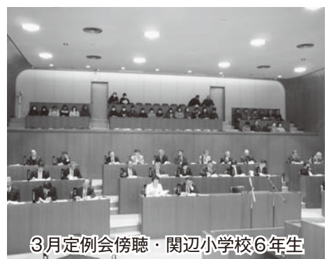
3月定例会傍聴・関辺小学校6年生